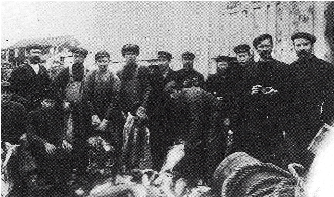
Valvær ca. 1910–15. Fiskerne tar hånd om fangsten. Bedehuset sees i bakgrunnen.