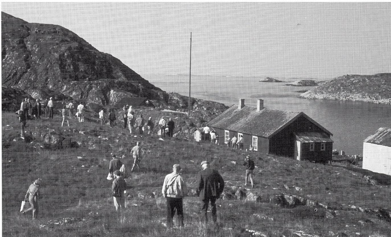
Historielagets tur til Valvær i 1988.

Også i 1915 måtte adskillige reparasjoner foretas. Det var innkjøpt orgel til huset, og dette harmonium var svært velklingende og godt - faktisk et av de beste husharmonium vi har spilt på!